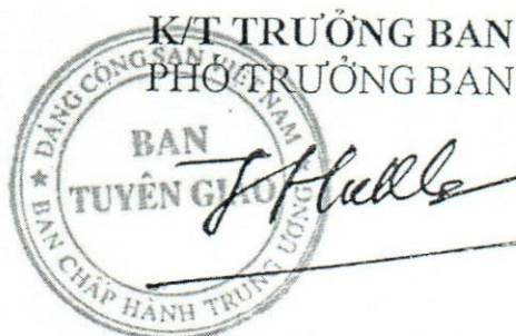
Phan Xuân Thủy