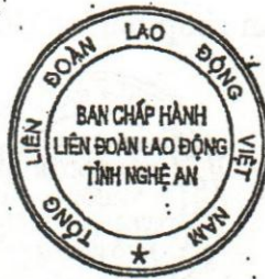
Mẫu số 36