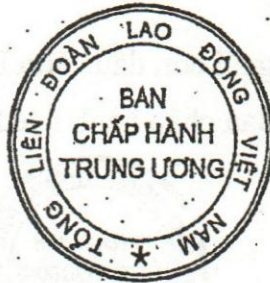
Mẫu số 35